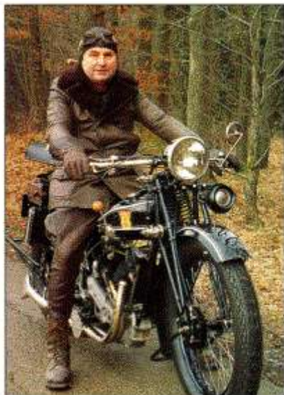
Einzigartig: Es dürfte schwer fallen, irgendwo auf der Welt eine zweite fahrbereite H 4 zu finden

An der Oberseite der Zylinderköpfe befinden sich sogenannte Zischhähne, die dazu dienen, eventuell "ersoffene" Zylinder auszublasen, oder, im entgegengesetzten Fall, Benzin direkt in die Zylinder zu spritzen. Der Vergaser stammt aus Nürnberg, die AMAC-Produkte sind vom britischen AMAL kaum zu unterscheiden. An der H 4 jedoch ist der Vergaser mit einem seitlich an der Mischkammer angeordneten Luftschieber versehen, ebenfalls eine Rarität.