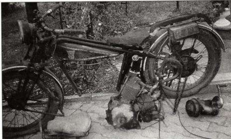
Typisch Hecker: Stecktank und patentierter Doppelrohrrahmen mit geschweißtem Lenkkopf