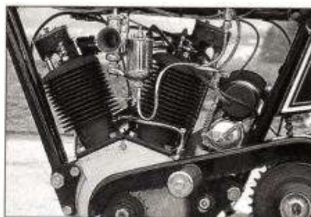
Hurth - ein Qualitätsbegriff im Getriebebau. Die Innereien waren nach 68 Jahren noch wie neu