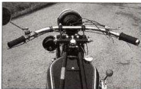
Alte Schule: Zischhähne auf den Zylindern und AMAC-Vergaser mit seitlichem Luftschleber